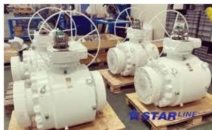
Starline è specializzata nella progettazione e produzione di valvole a sfera per applicazioni industriali, soprattutto in ambito Oil & Gas

L'evento, organizzato da Confindustria Bergamo e Promoberg, è in programma dal 19 al 21 maggio 2026 presso la Fiera di Bergamo.