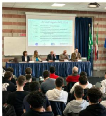
Il progetto di formazione e training è promosso da IVS – Industrial Valve Summit

L'iniziativa risponde inoltre a un'esigenza sempre più sentita dalle aziende: la carenza di manodopera qualificata. In assenza di percorsi di studio specifici, il settore fatica a essere percepito come attrattivo dal mondo della scuola. Con IVS Young, offriamo agli studenti l'opportunità di conoscere da vicino un comparto strategico e le sue prospettive professionali".