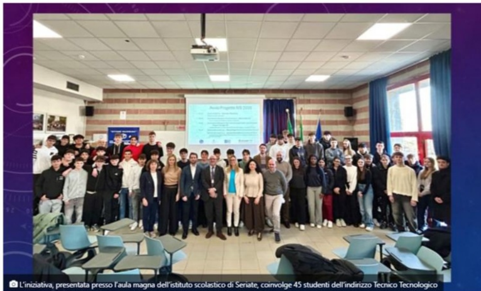
L'iniziativa, presentata presso l'aula magna dell'istituto scolastico di Seriate, coinvolge 45 studenti dell'indirizzo Tecnico Tecnologico

Facebook X LinkedIn Condividi via Email Stampa